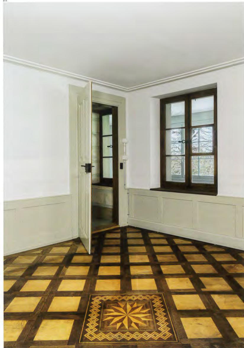
Abb. 22 Zimmer West im Obergeschoss mit Parkettboden. Foto 2016.

Abb. 23 Vom Ofenbauer Egli signierte Kachel am Ofen von 1828. Der Spruch nimmt Bezug auf das liberale Wochenblatt «Der Schweizerbote». Foto 2016.