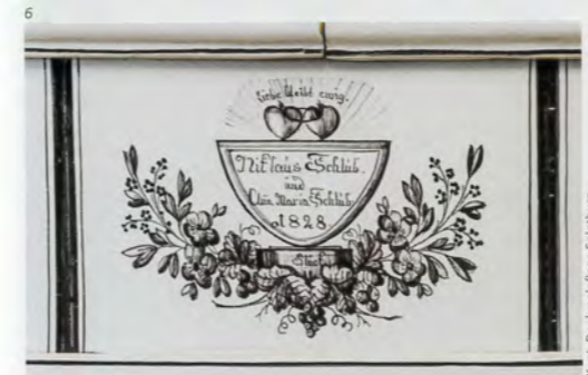
Kant. Denkmalpflege, Solothurn.