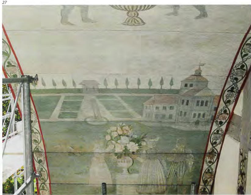
Abb. 27 und 28 Szene eines herrschaftlichen Landsitzes mit Gartenanlage am westlichen Fuss der Rindeuntersicht. Es ist anzunehmen, dass es sich beim Paar unten rechts um Anna-Maria und Niklaus Schlup-Schlup handelt. Links Zustand nach der Restaurierung von 2015, rechts vor der Restaurierung.