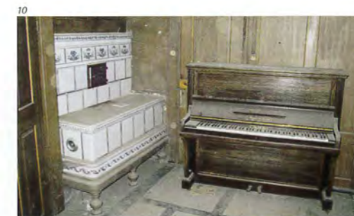
Abb. 10–12 Impressionen vor der Restaurierung: Kachelofen und Klavier im Zimmers Süd des Erdgeschosses (oben), Küche mit Hutte (Mitte) und Keller mit Kreuzgewölbe (unten). Fotos 2013.