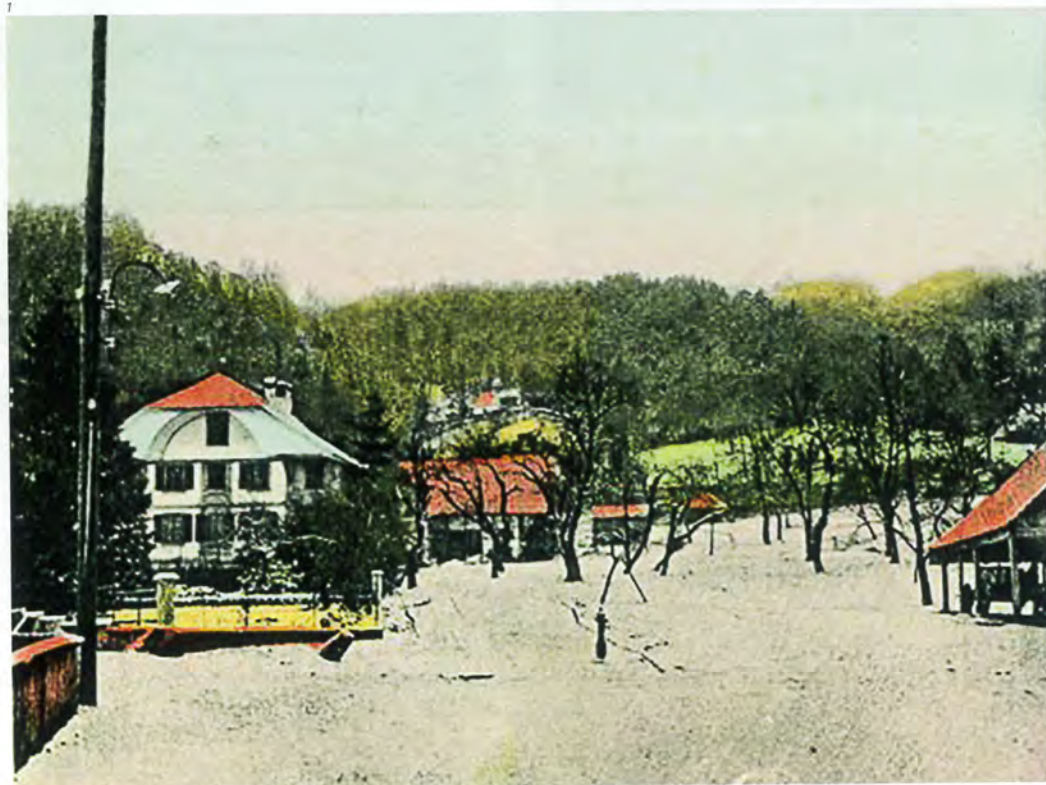
Abb. 1 Ausschnitt aus einer Postkarte von 1913 mit dem Wohnstock und dem vorgelagerten Garten. Der Riesen-Lebensbaum (Thuja, am linken Bildrand) hatte bereits damals eine beachtliche Grösse und dürfte etwas älter sein als die mündlichen Überlieferungen glauben machen.