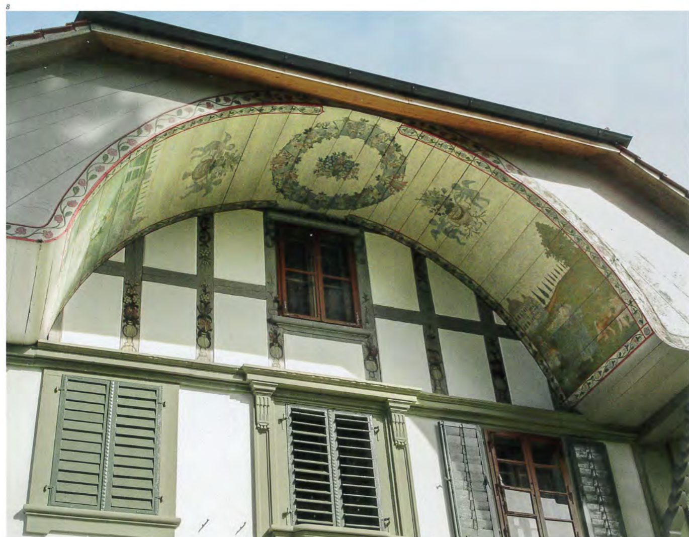
Abb. 8 Untersicht der Ründe mit dekorativen Malereien nach der Restaurierung. Foto 2017.