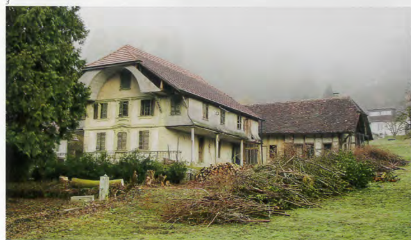
Kant. Denkmalpflege, Solothurn.