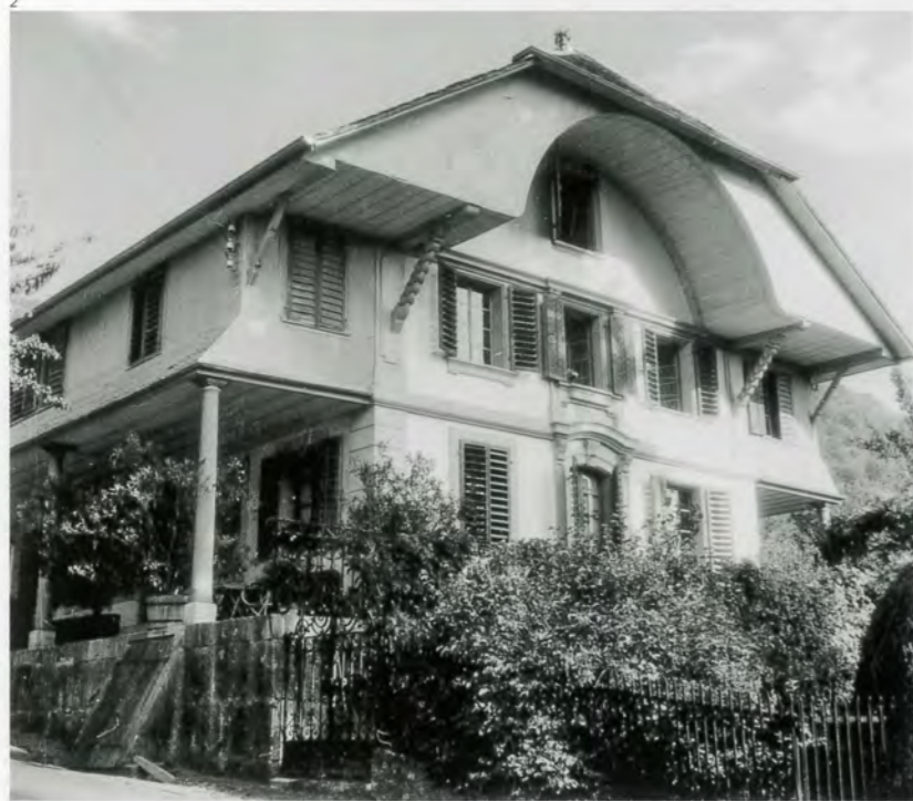
Kant. Denkmalpflege, Gottlieb Leutschner.