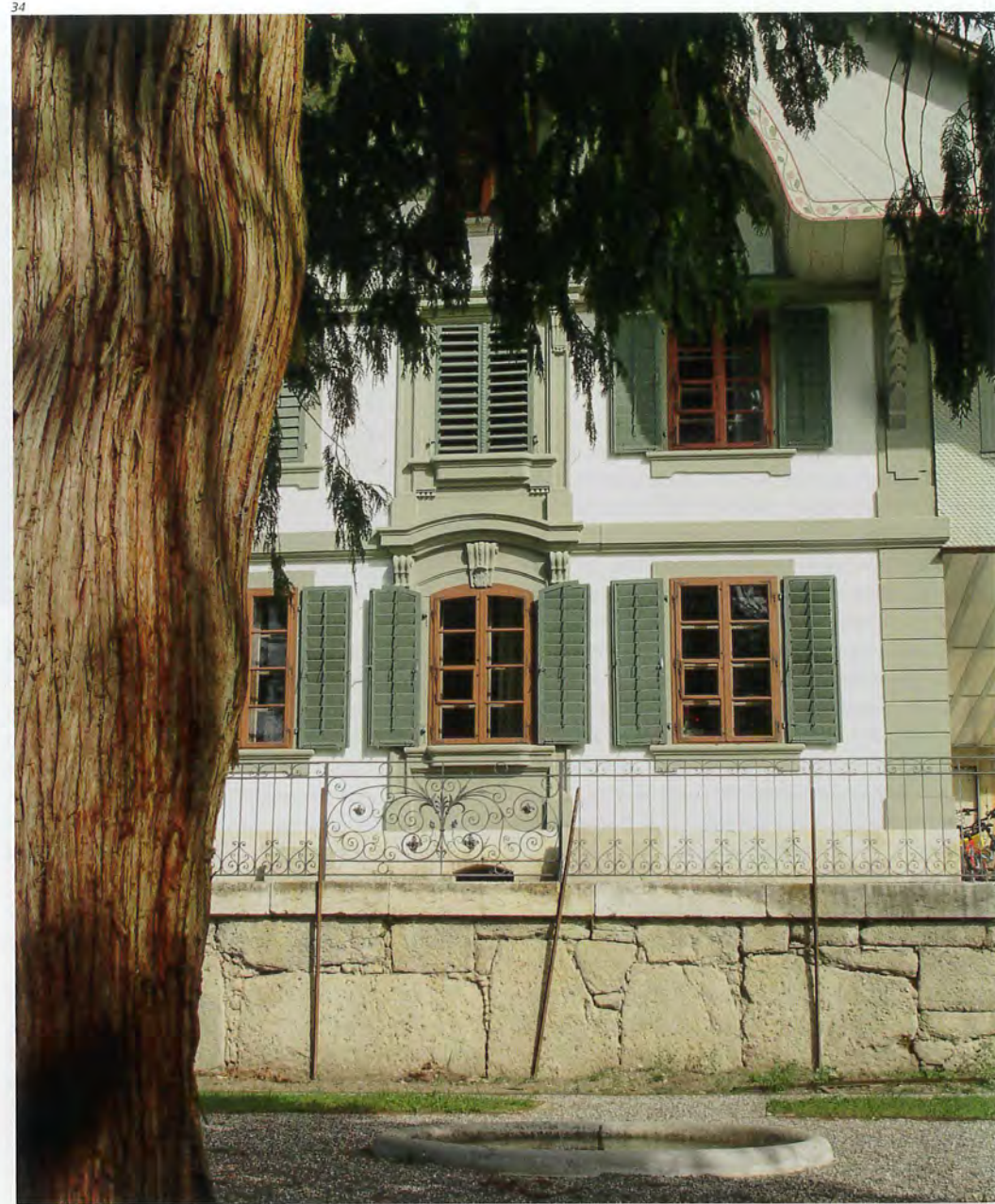
Abb. 34 Impression mit Ausschnitt der dekorativen Südfassade, dem Rondell mit Springbrunnen und dem Thuja-Baum. Foto 2017.