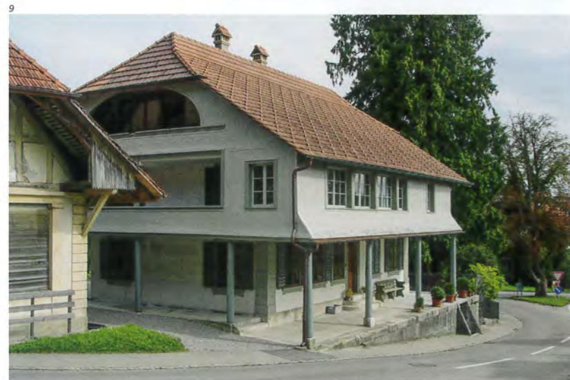
Abb. 9 Ansicht von Norden mit der umlaufenden, mit Holz- schindeln verkleideten Laube. Foto 2017.

ren sie wahrscheinlich nicht direkt miteinander verwandt. Sicher ist aber auf jeden Fall, dass durch die Heirat zwei ausgesprochen reiche Familien aus der bäuerlichen Oberschicht des Bucheggbergs zusammenfanden.